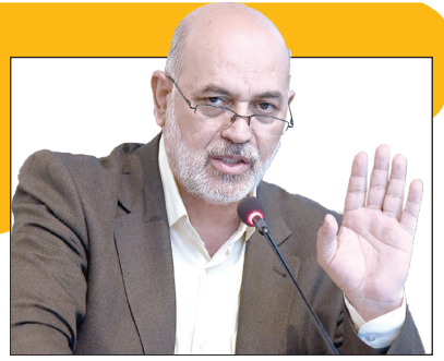
رئیس شورای شهر شیراز عنوان کرد:

ارتقای کیفیت زندگی و افزایش رضایت عمومی یعنی موفقیت مدیریت شهری