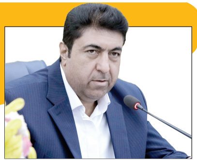
رئیس سازمان سیما و فضای سبز شهرداری خبر داد:

ارتقای کیفیت زندگی و افزایش رضایت عمومی یعنی موفقیت مدیریت شهری