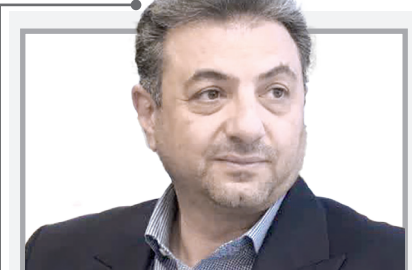
کام بلند شهرداری شیراز در مسیر شایسته‌سالاری؛

رئیس اداره حمل‌ونقل مسافر اداره کل راهداری و حمل و نقل جاده‌ای فارس در ادامه به نظارت و بازرسی در این حوزه اشاره داشت و گفت: در راستای صیانت از حقوق مسافران در مدت زمان مذکور تخلفات ۱۲ شرکت مسافری و ۶ راننده این حوزه در سامانه مربوطه - شجاز - جهت طرح در کمیسیون‌های ذیربط ثبت و ارجاع شد همچنین در زمینه جلوگیری از قاچاق سوخت نیز ۲۰ مورد گزارش‌های اخذشده از سامانه ۱۴۱ مورد