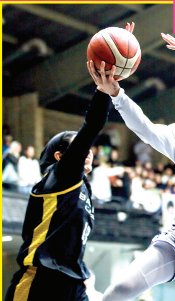
شاگردان النی به دنبال پیروزی برابر حریفان